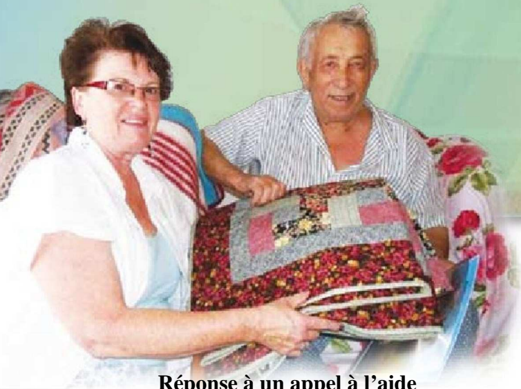
Réponse à un appel à l'aide