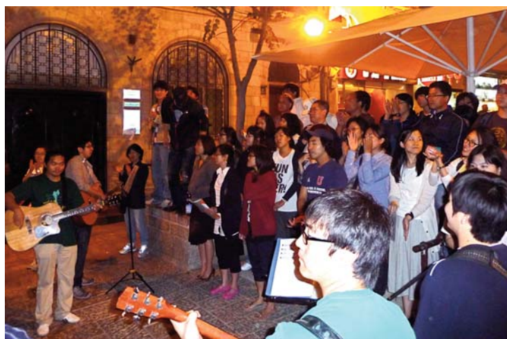
Chrétiens de Corée du Sud à Jérusalem

Vous présentant à nouveau tous nos vœux pour 2012.