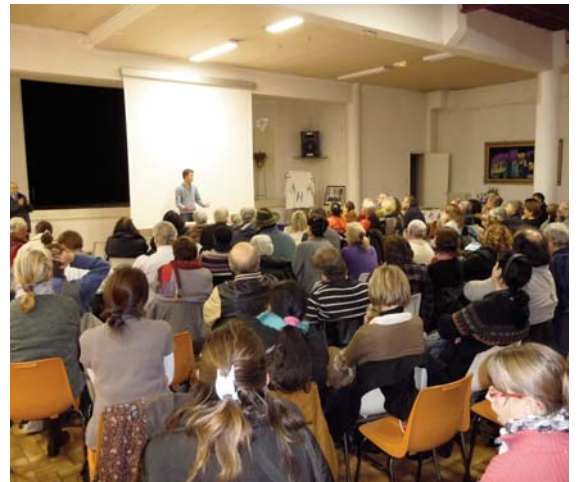
L'auditoire du CCJ